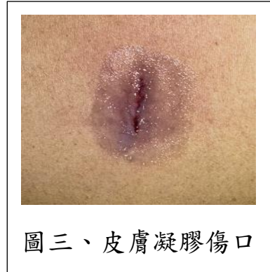
圖三、皮膚凝膠傷口

(5)結紮手術:2週內避免性行為及3個月後需做精液追蹤，期間性行為仍需做避孕措施。