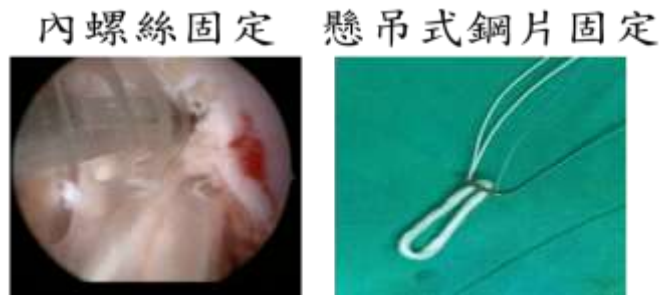
圖三、肌腱植入物於骨通道之不同固定方式。

式固定螺絲(圖三左)(2)外懸吊式小鋼片(圖三右)。這兩種固定的使用方式不同，手術後也需要膝支架進行固定。