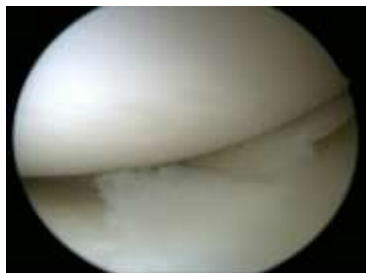
圖四、關節鏡下損傷之半月板。

如於手術前或關節鏡下有發現合併其他膝關節結構之損傷，將視情況進行治療。最常見之損傷為半月板破裂(圖四)，軟骨損傷，其他的膝關節韌帶損傷。依不同損傷狀況，醫師將選擇進行清創，部分切除，修補或重建。