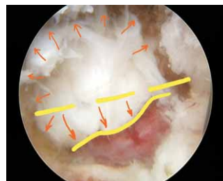
內視鏡放大數十倍，能夠將清楚的分辨大塊的椎間盤碎片以及下方被壓扁的神經