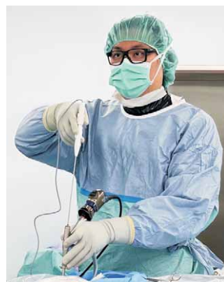
手術中精準止血，將風險降到最低