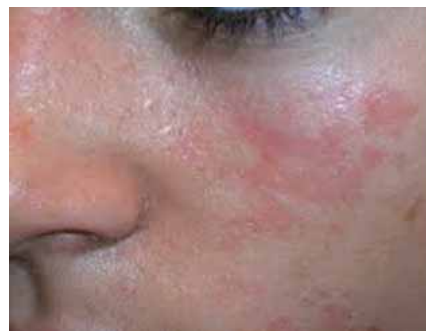
敏感肌膚可能出現之皮膚紅腫變化

成分的功能性產品。常見的保濕成分像是神經醯胺、角鯊烷、玻尿酸、天然保濕因子等吸水鎖水成分可幫助皮膚補充水分。常見舒緩和修復成分像是神經胜?、維生素原B5、尿囊素等都是臨床實驗有效的成分，可以嘗試使用。但因為每個人的皮膚適應狀況不同，還是建議試用之後再選擇最適合的產品。