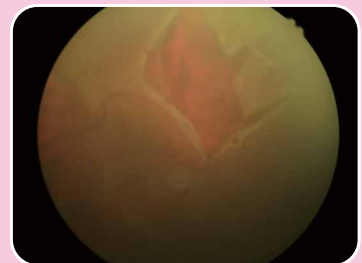
造成視網膜剝離的元兇—視網膜裂孔